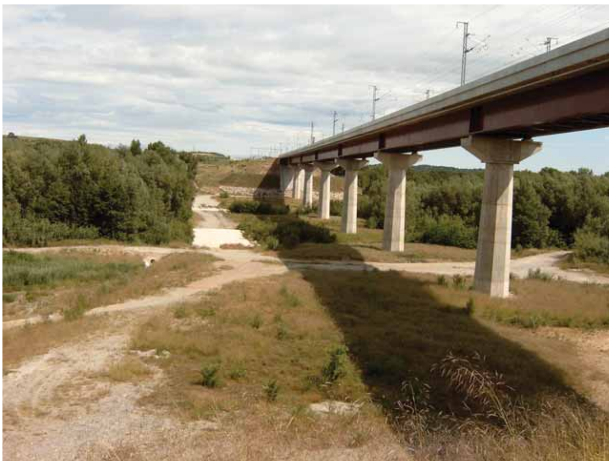
La ripisylve du Tech traversée par la LGV

Ces mesures ne pourront toutefois remédier intégralement aux effets dommageables du projet sur la faune et la flore, notamment en raison de l'élévation de température du sol et de l'effet des servitudes qui interdiront toute plantation ou repousse de végétaux à racines profondes.