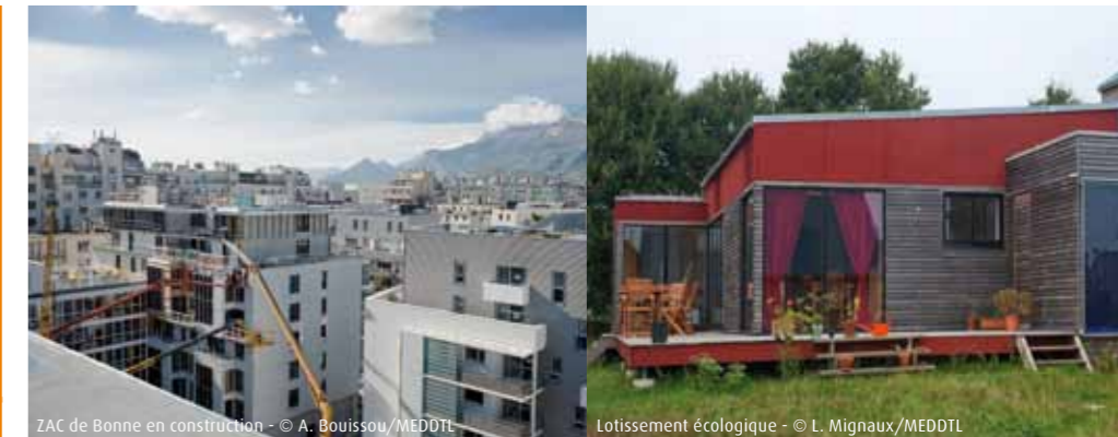
ZAC de Bonne en construction

Concernant le site internet ÉcoQuartier, sa fréquentation est en hausse depuis 2009 et une nouvelle version du site, intégrée au site du ministère du Développement durable, est prévue en 2011.