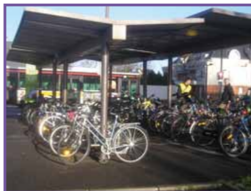
Véloparc à un point d'arrêt de transports collectifs

Au-delà du simple respect de leurs obligations légales, les collectivités en charge de l'aménagement de la voirie ont tout intérêt à mettre en place les dispositions de cet article afin de favoriser la sécurité des circulations, la mise en place progressive de réseaux cyclables urbains, le développement de l'usage des modes doux... Penser dès l'amont des projets aux aménagements cyclables, c'est une nouvelle manière de penser la ville et le partage de la voirie.