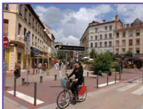
Vélo en libre-service

Instabilité juridique du projet : comme toutes les obligations qui incombent aux collectivités territoriales, le non respect des dispositions prévues par l'article L. 228-2 du code de l'environnement peut aboutir à l'annulation des délibérations approuvant le projet soit par la voie d'un déferé préfectoral soit à la demande d'un administré ou d'une association d'usagers cyclistes qui en ferait la demande. Plusieurs cas récents ont été jugés en ce sens.