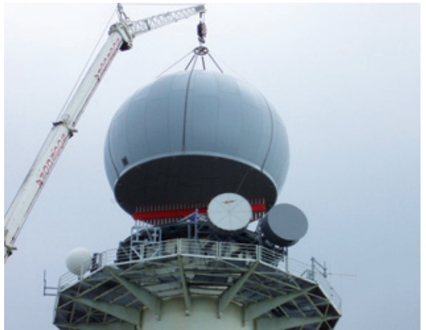
Pose du radôme du radar de Pierre-sur-Haute

Le guidage radar devrait être effectif en avril 2010 et la réduction des séparations dans la FIR (Flight Information Region) Tahiti est prévue pour fin 2010. Deux nouveaux radars secondaires avec interrogation sélective, appelés « mode S » ont été mis en service à Saint Goazec (Finistère) et Pierre-sur-Haute (Loire). Le déploiement de la couverture radar de dernière génération s'est poursuivi avec la livraison des radars de Grasse et du Mont Ventoux. Les passages en « mode S » des radars de Marseille, du Grand ballon, de Palaiseau et de Nevers ont été également une belle réussite.