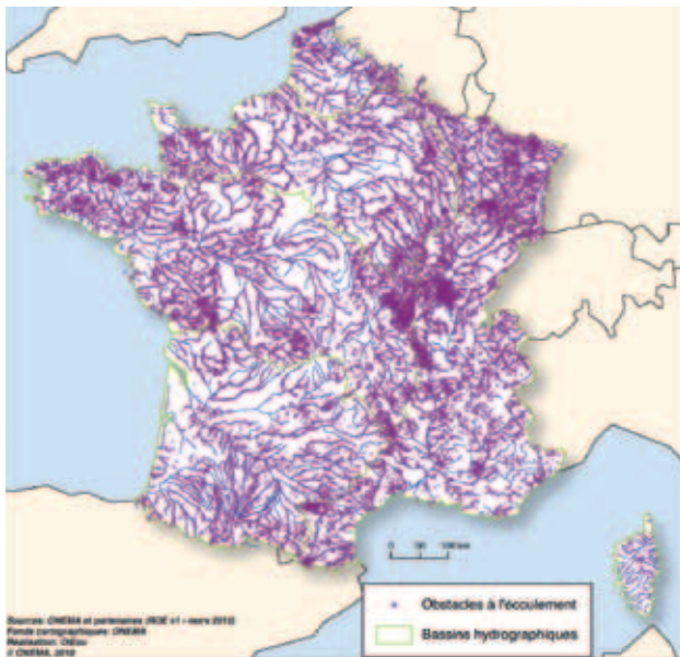
Les obstacles à l'écoulement recensés en France dans la base ROE

Grâce à leurs connaissances précises du terrain, les services territoriaux de l'Onema ont ensuite effectué un travail de vérification pour chaque ouvrage en éliminant les doublons ou les ouvrages disparus, en précisant leur localisation, en complétant le recensement avec d'autres informations locales disponibles. Enfin, un code national unique (matricule de l'obstacle) a été attribué à chaque obstacle. Chaque acteur pourra utiliser ce matricule notamment en vue des futurs échanges de données entre partenaires et pour synthétiser les informations au niveau national.