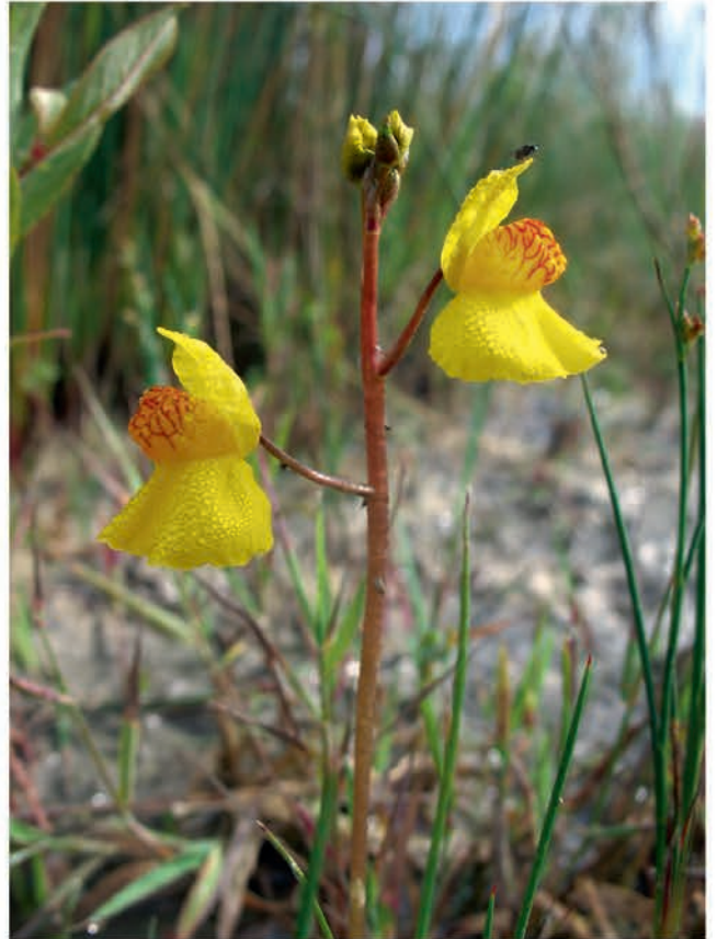
Colonisation d'une espèce protégée (Utricularia citrina) sur un secteur réaménagé.