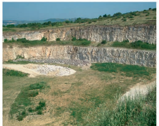
Maintien des fronts de taille réaménagés pour la nidification des espèces rupicoles.

L'efficacité de la séquence ERC est favorisée par sa mise en œuvre planifiée et anticipée dès la conception du projet et pour chacune de ces trois phases.