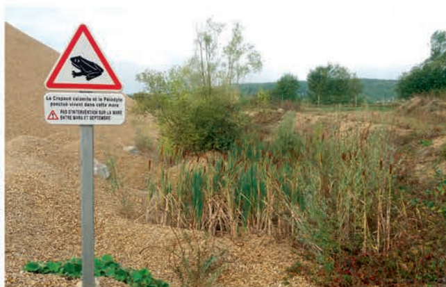
Balisateur préventif d'un site de reproduction d'amphibiens sur une installation de traitement.