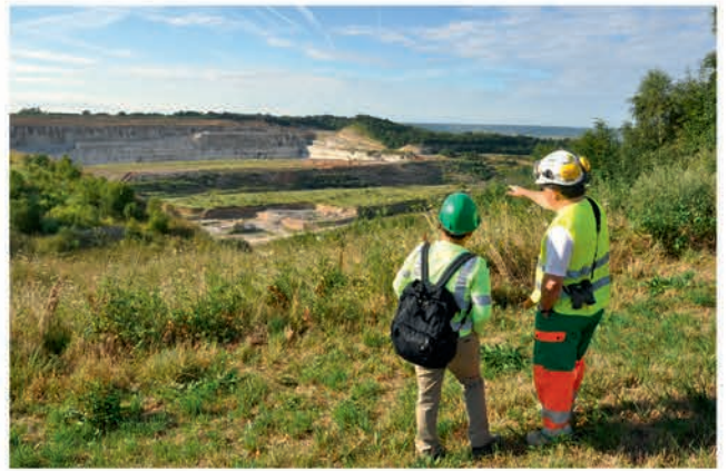
Suivis écologiques du réaménagement coordonné à l'exploitation.

La mise en pratique de ce nouvel outil pourra être utilement enrichie par les futurs retours d'expériences de la profession et autres guides méthodologiques qui pourront être produits sur le même sujet.