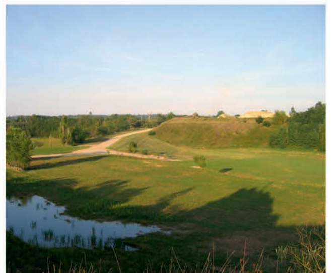
Réaménagement écologique d'une mosaïque de milieux exploitant les potentialités du site après remise en état.

Il est recommandé de mettre en œuvre les mesures compensatoires dès les premières phases de l'exploitation de façon à pouvoir s'assurer de leur réussite et de leur effectivité dans le délai de l'autorisation préfectorale.