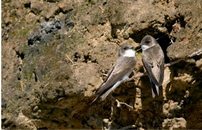
Hirondelles de rivage, espèce typique des fronts sableux de carrières.

et de garantir sa transition après exploitation. Pour ce faire, il peut mettre en œuvre ou adapter les mesures de gestion temporaire des habitats dans le périmètre autorisé.