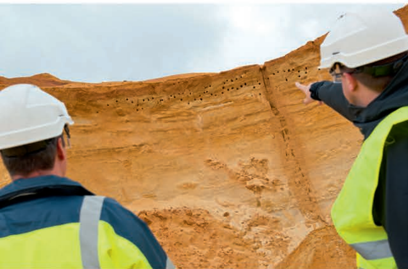
Site de reproduction de guépiers d'Europe évité en phase d'exploitation.