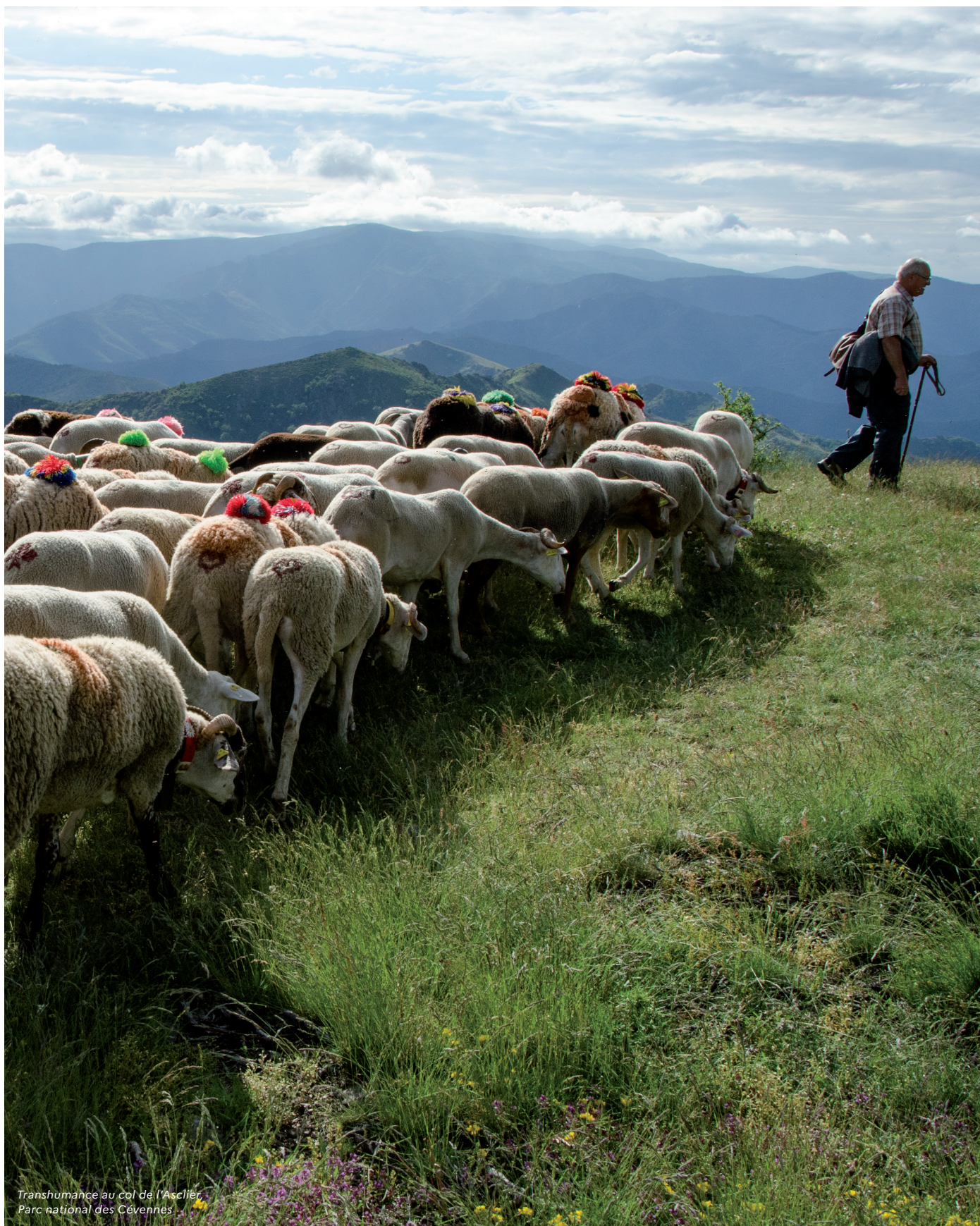
Transhumance au col de l'Asclier, Parc national des Cévennes