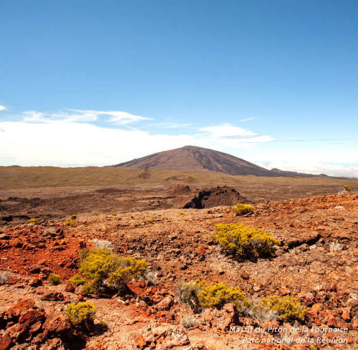
Massif du Piton de la Fournaise Parc national de la Réunion

Les objectifs de consolidation du réseau d'aires protégées s'appuieront, en fonction des dynamiques locales, sur des contributions à l'initiative des collectivités locales, en mobilisant les outils fonciers et réglementaires et en s'appuyant sur les dynamiques de territoire.