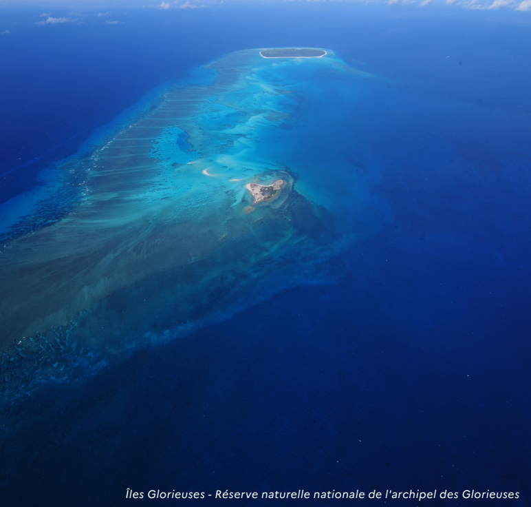
Îles Glorieuses - Réserve naturelle nationale de l'archipel des Glorieuses

La stratégie renforcera ainsi le rôle structurant des aires protégées dans les suivis de long terme. Elle les positionnera en véritables sentinelles, à travers notamment des observatoires thématiques inter-sites et inter-réseaux d'aires protégées, au service des stratégies de gestion locale des aires protégées et autres niveaux de rapportage.