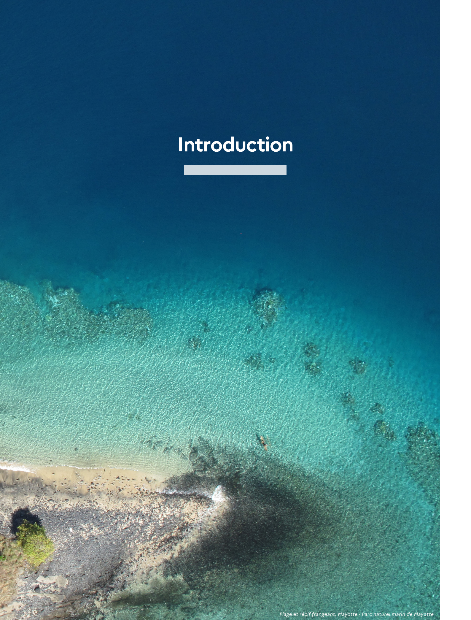
Plage et récif frangeant, Mayotte - Parc naturel marin de Mayotte