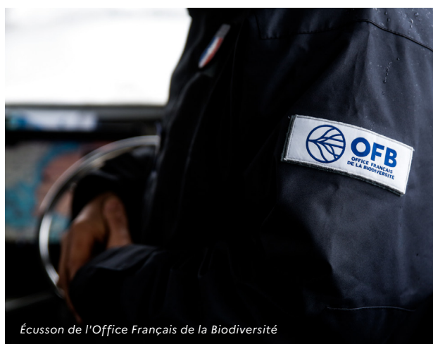
Écusson de l'Office Français de la Biodiversité

Afin de passer d'une politique de moyens à une politique de résultats et de rapportage, rendant la politique des aires protégées plus lisible et soutenue par les acteurs et les citoyens, la stratégie promeut la mise en place d'une gestion de qualité du réseau national d'aires protégées en intégrant les principes de planification et d'évaluation de la gestion des aires protégées (mesure 7), avec des documents de gestion, lisibles, basés sur des objectifs prioritaires, suivis par des indicateurs dans un cadre de gouvernance approprié.