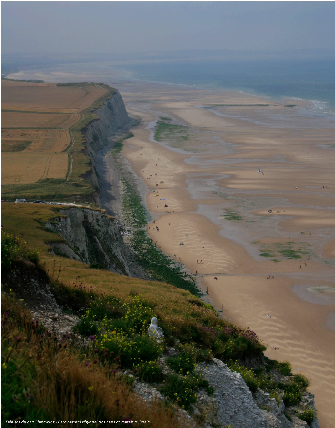
Falaises du cap Blanc-Nez - Parc naturel régional des caps et marais d'Opale