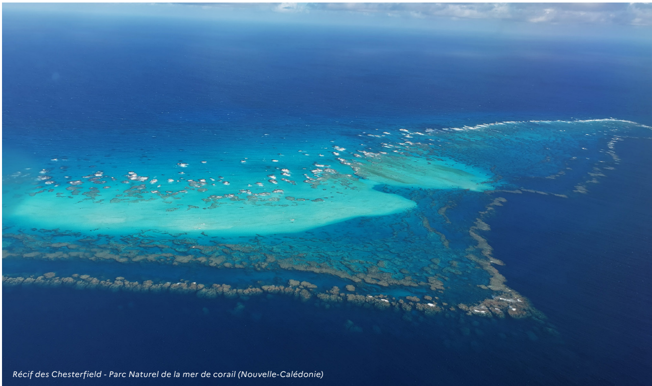
Récif des Chesterfield - Parc Naturel de la mer de corail (Nouvelle-Calédonie)

L'une des conditions de réussite de la future stratégie réside notamment dans l'opérationnalité de sa mise en œuvre, aux niveaux national et territorial, ainsi que dans le suivi et l'évaluation dynamique des actions prévues.