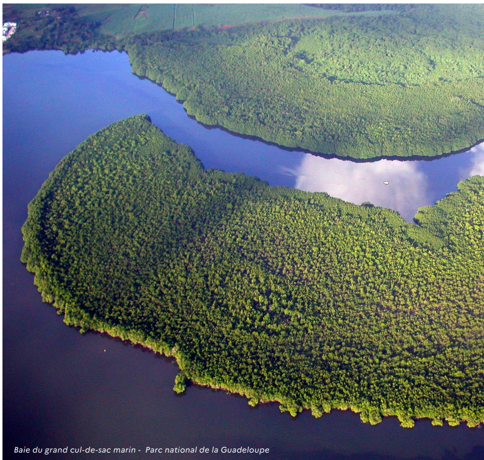
Baie du grand cul-de-sac marin - Parc national de la Guadeloupe

Dans le cadre de la stratégie nationale pour les aires protégées 2030, la France poursuivra, notamment, son action en faveur du renforcement du réseau d'aires marines protégées dans les Caraïbes.