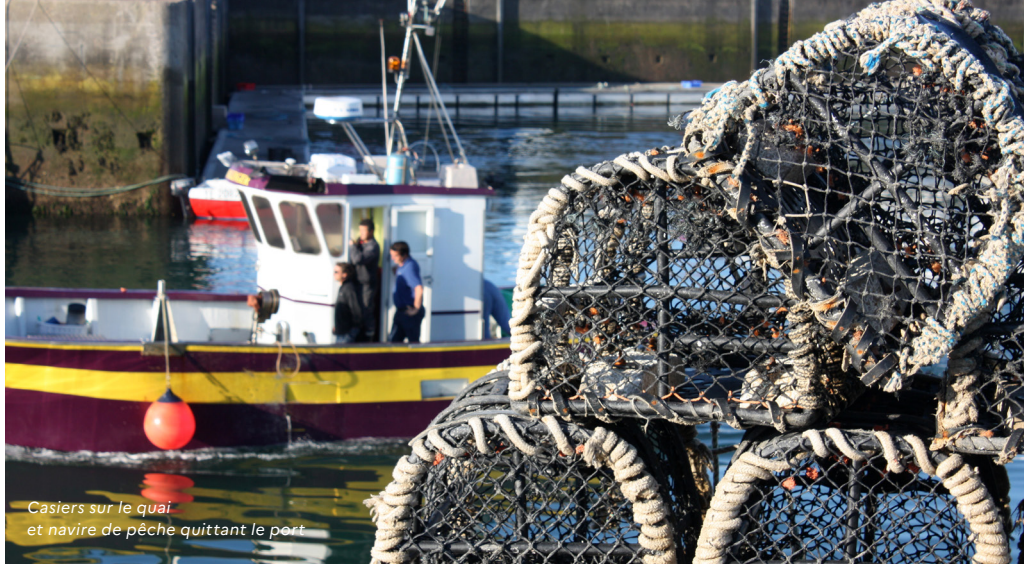
Casiers sur le quai et navire de pêche quittant le port

Les aires protégées, grâce à la qualité des services écosystémiques qu'elles offrent, sont le support de nombreux usages, professionnels ou de loisir : pastoralisme, agriculture, sylviculture, pêche, tourisme, chasse, cueillette, activités culturelles, activités sportives, activités spirituelles, équipements ou aménagements divers liés par exemple à la mobilité ou à l'approvisionnement en eau ou en énergie, etc. Les usages, par leur présence à proximité de l'aire protégée ou en son sein, ont des impacts potentiels sur l'état du patrimoine à protéger, qui peuvent être positifs ou négatifs. C'est ainsi le premier objectif de toute aire protégée que de favoriser la meilleure compatibilité des usages avec la conservation du patrimoine, et de valoriser les services écosystémiques dont ces usages dépendent.