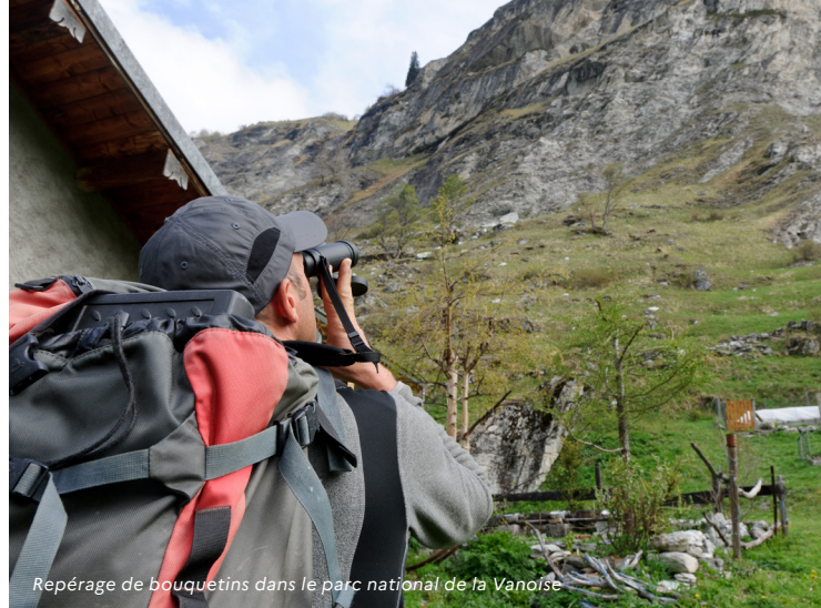
Repérage de bouquetins dans le parc national de la Vanoise

Dici 2030, les aires protégées doivent bénéficier d'un accès suffisant à la donnée scientifique pour exercer une gestion de qualité, en s'appuyant notamment sur les données bancarisées dans les systèmes d'information sur la biodiversité (SI Biodiversité), le milieu marin (SIMM) et l'eau (SI Eau). Des rencontres régulières seront organisées pour faciliter les échanges et des outils de partage de l'information en réseau seront mis en place via un portail collaboratif entre gestionnaires et chercheurs. Un soin particulier sera porté à l'accessibilité de la donnée grâce à des synthèses et vulgarisations scientifiques multidisciplinaires. Par ailleurs, les aires protégées contribueront de façon exemplaire à alimenter ces différents systèmes d'information. Un accompagnement sera à prévoir pour lever les éventuels freins concernant l'accès aux données (convention d'Aarhus, loi Lemaire, etc.). Des catalogues complets et actualisés de protocoles et d'indicateurs seront mis à disposition des gestionnaires.