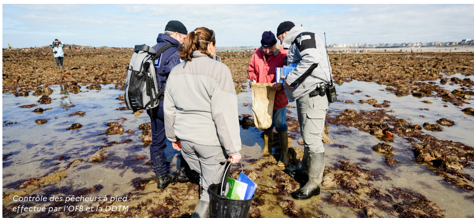
Contrôle des pêcheurs à pied effectué par l'OFB et la DDTM

En mer, les besoins de contrôle de chaque aire marine protégée sont intégrés dans le plan de surveillance et de contrôle de façade maritime. La surveillance et le contrôle des activités ayant un impact sur l'environnement marin s'appuient sur la mobilisation de l'ensemble des administrations de l'action de l'État en mer concourant à la mise en œuvre des plans de contrôle pour l'environnement marin de chaque bassin et façade maritime, sous la coordination opérationnelle des préfets maritimes et des délégués du gouvernement pour l'action de l'État en mer en outre-mer. Sont concernées principalement : les Affaires maritimes, la Marine Nationale, la Gendarmerie nationale et les Douanes. La mise en œuvre des plans de contrôle pour l'environnement marin s'appuie également sur la mobilisation des opérateurs de l'État (Office français de la biodiversité notamment). À ces moyens s'ajoutent ceux des gestionnaires d'aires protégées. Le CACEM (centre d'appui au contrôle de l'environnement marin) est chargé d'appuyer les unités et de centraliser le rapportage.