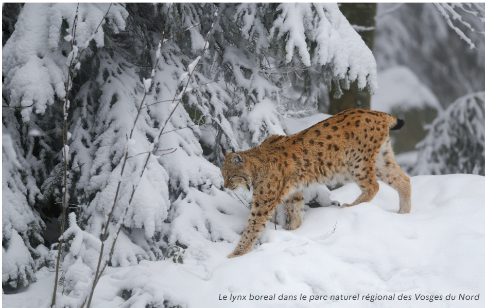
Le lynx boreal dans le parc naturel régional des Vosges du Nord

A dapter la gestion des aires protégées dans un contexte de changement global repose sur une double exigence : doter les aires protégées et leurs gestionnaires des données nécessaires à l'orientation de la gestion, mais également mobiliser les aires protégées comme sites d'études et d'observation de l'évolution du vivant ou de la gestion des patrimoines, naturels, culturels ou paysagers.