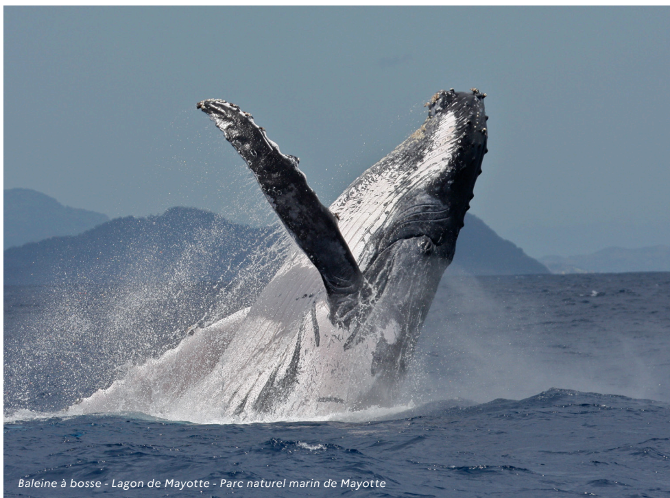
Baleine à bosse - Lagon de Mayotte - Parc naturel marin de Mayotte

La lutte contre l'érosion de la biodiversité est un enjeu international de premier ordre. Dans ce contexte, le réseau français des aires protégées constitue un outil déterminant pour contribuer à cet effort, notamment en matière de coopération régionale mais aussi internationale : coopérations transfrontalières et régionales autour de l'Hexagone et de la Guyane, dans les Caraïbes et dans les océans Indien, Pacifique, Antarctique Atlantique et Austral.